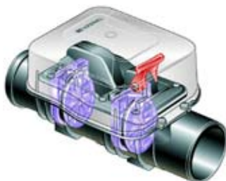
Eksempel på højvandslukke

En anordning, der kan lukkes både manuelt og automatisk, så der ikke kan strømme vand ind i rørene eller i bygningen bag højvandslukket.