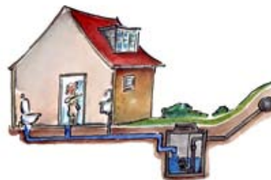
Eksempel på pumpebrønd

Anlæg til at pumpe afløbsvand væk. Anlægget består normalt af en eller flere pumper anbragt i en opsamlingsbeholder eller brønd.