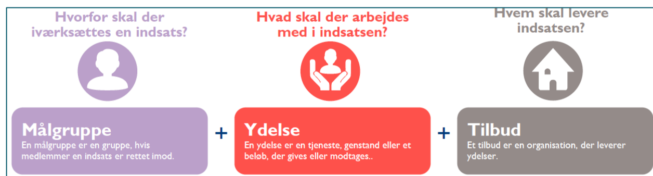
Figur 1: Fælles Faglige Begreber – Hvorfor, hvad og hvem

Indsatser bevilges med det formål at styrke den enkeltes egne muligheder og eget ansvar for at udvikle sig og udnytte egne potentialer i det omfang, det er muligt for den enkelte. Se figur 1 nedenfor, der illustrerer de pejlemærker der arbejdes ud fra i visitationen.